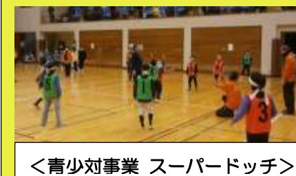
<青少対事業 スーパードッジ>