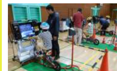
<交通安全教室（自転車）>