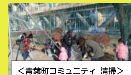
<青葉町コミュニティ 清掃>