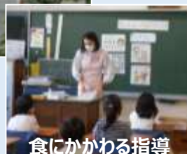
食にかかわる指導