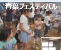
青葉フェスティバル